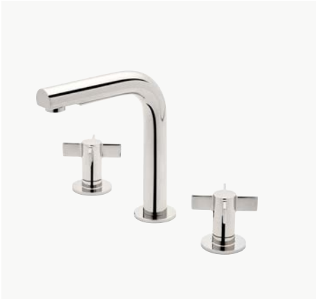
Robinet de lavabo à profil haut avec poignées à croisillons MODÈLE : NLS210