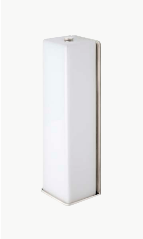
Applique murale simple avec abat-jour rectangulaire MODÈLE : NO01LT