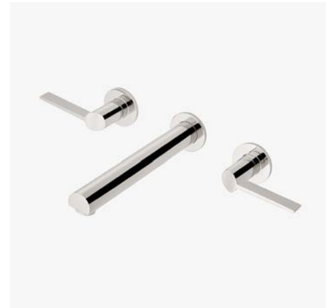
Robinet de lavabo mural avec poignées à levier inclinées* MODÈLE : NLS760