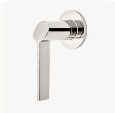
Commande de débit avec poignée à levier inclinée* MODÈLE : NOVCE6