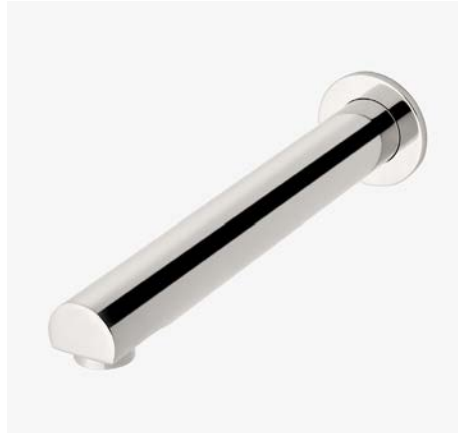
Bec de baignoire mural MODÈLE : NOTS01