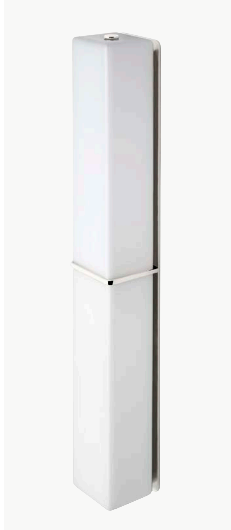
Applique murale double avec abat-jour rectangulaire MODÈLE : NO02LT