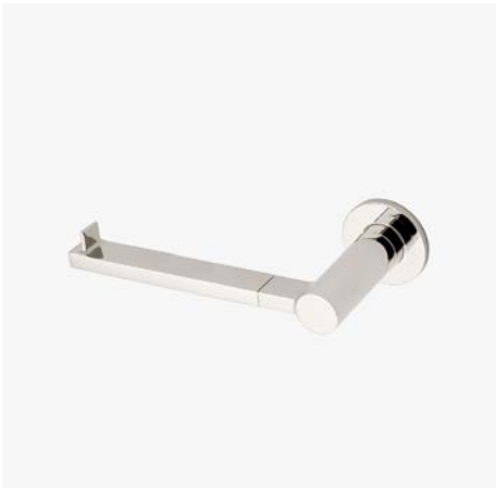
Porte-papier à bras unique MODÈLE : NOPH01