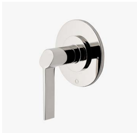
Habillage avec inverseur thermostatique à deux voies avec points modernes et poignée à levier inclinée* MODÈLE : NO2T60