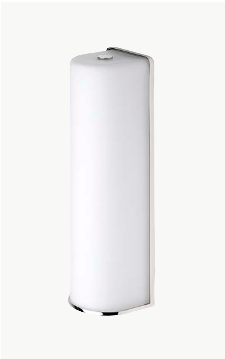
Applique murale simple avec abat-jour cylindrique MODÈLE : NO03LT