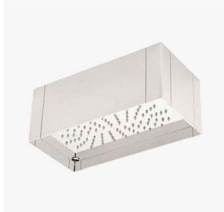
Universal pomme de douche encastrée Cube 6" x 12" MODÈLE : USHF12 (US) / USHF12E (EU)