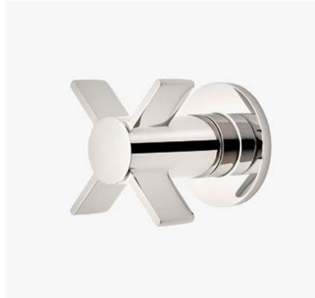
Commande de débit avec poignée à croisillons* MODÈLE : NOVCI0