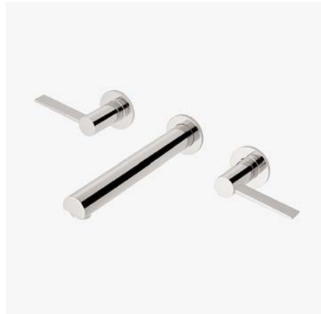
Robinet de lavabo mural avec poignées à levier* MODÈLE : NLS720