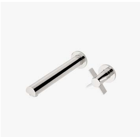
Robinet de lavabo mural avec poignée à croisillons simple* MODÈLE : NLS310