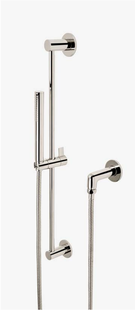
Douchette sur rail MODÈLE : NOHS10