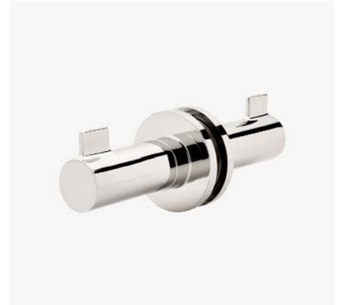
Crochets double face montés sur verre MODÈLE : NORHG2