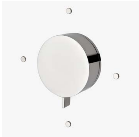
Habillage de vanne de contrôle du débit et d'inverseur avec poignée-bouton moleté* MODÈLE : NOVCE3