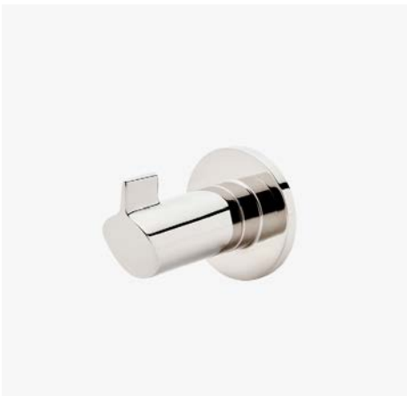
Crochet incliné simple MODÈLE : NRH01S