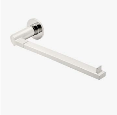
Porte-serviettes incliné 10" pour invités MODÈLE : NTB10S