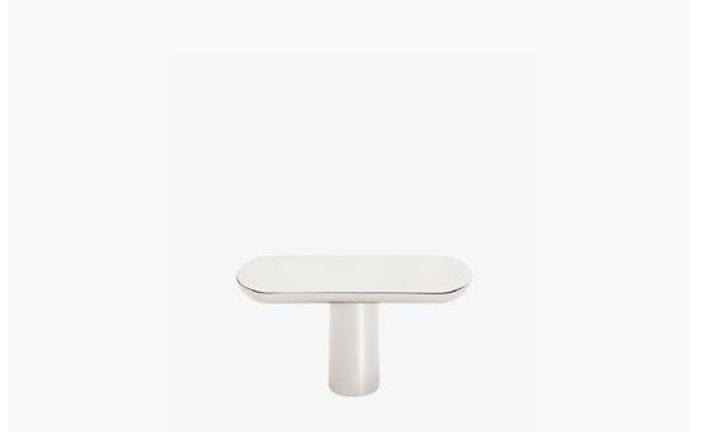
Tirette 2 ½" MODÈLE : NOHW02