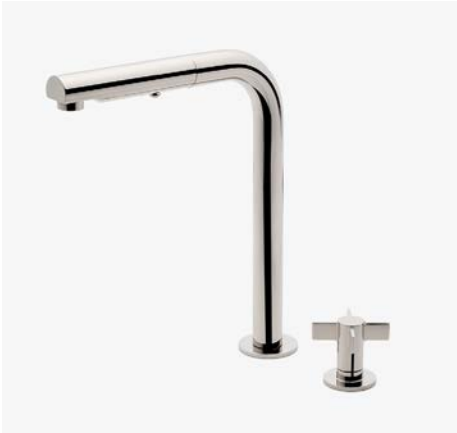
Mitigeur de cuisine à deux trous avec poignées à croisillon et douchette intégrée MODÈLE : NKM210