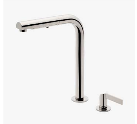
Mitigeur de cuisine à deux trous avec poignée à levier inclinées et douchette intégrée MODÈLE : NKM260