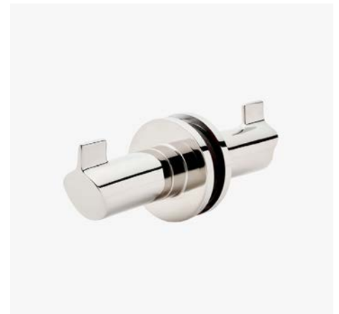
Crochets inclinés double face montés sur verre MODÈLE : NRHG2S