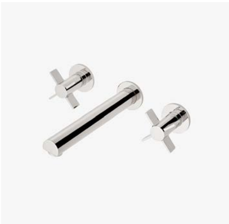
Robinet de lavabo mural avec poignées à croisillons* MODÈLE : NLS710