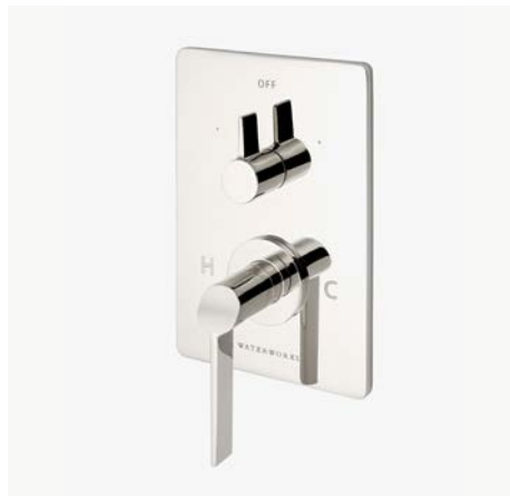
Habillage avec thermostatique et inverseur intégré avec poignée à levier inclinée* MODÈLE : NVT260