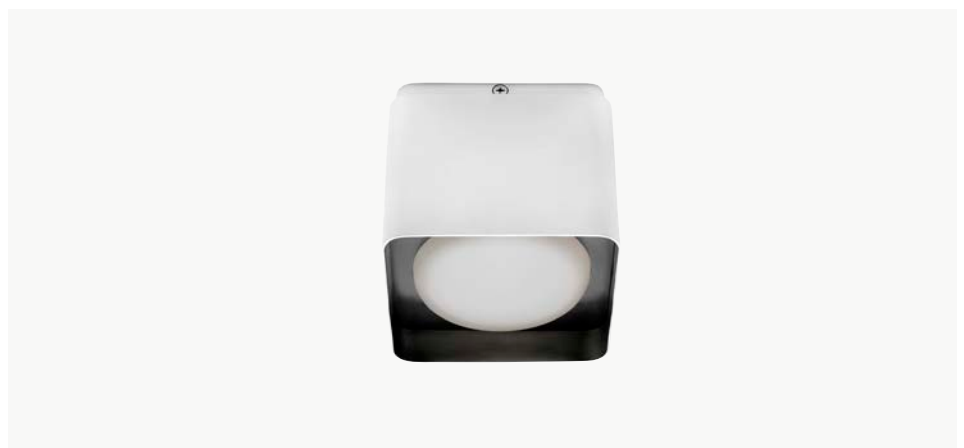
Applique / Plafonnier cubique MODÈLE : NO05LT