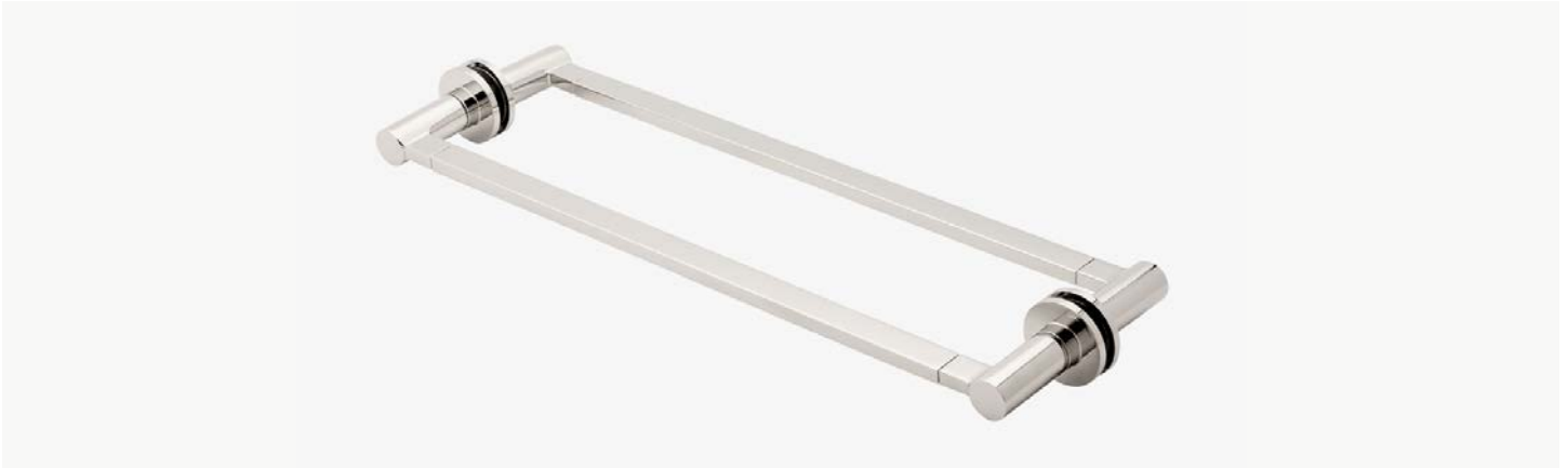
Porte-serviettes 24" double face en verre MODÈLE : NO24G2