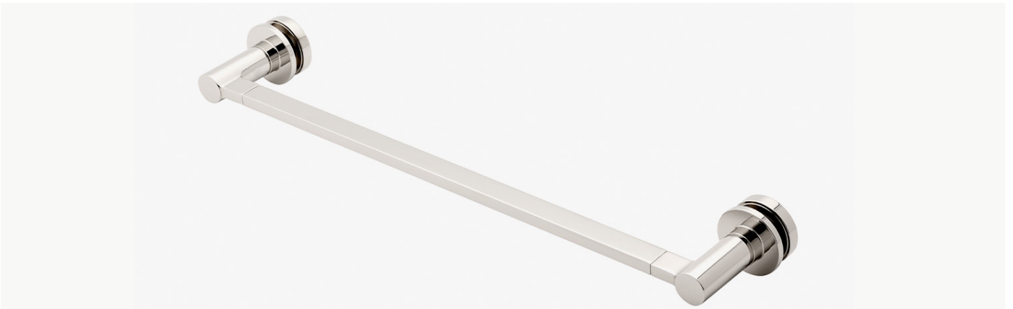
Porte-serviettes 24" en verre simple face MODÈLE : NO24G1