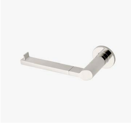
Porte-papier incliné à un bras MODÈLE : NPH01S