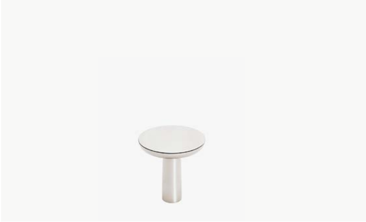
Bouton de 1 ¼" MODÈLE : NOHW01