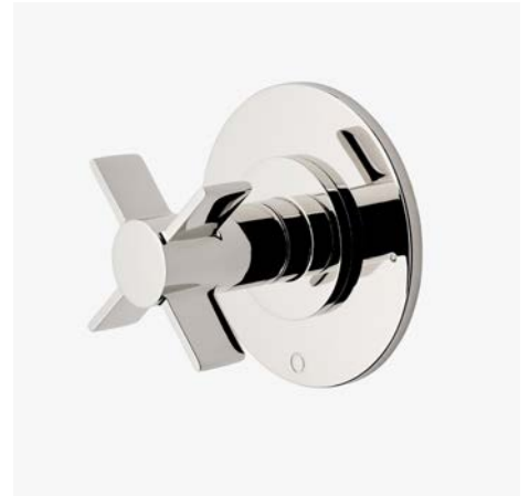
Habillage avec inverseur thermostatique à deux voies avec points modernes et poignée à croisillons* MODÈLE : NO2T10