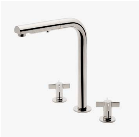
Mitigeur de cuisine à trois trous avec poignées à croisillon et douchette intégrée MODÈLE : NKM310