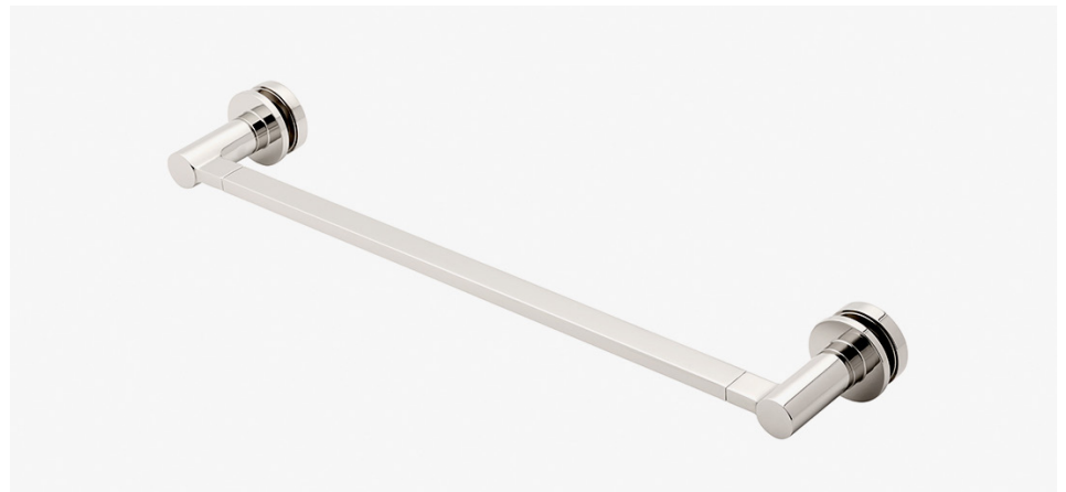
Porte-serviettes 18" en verre simple face MODÈLE : NO18G1