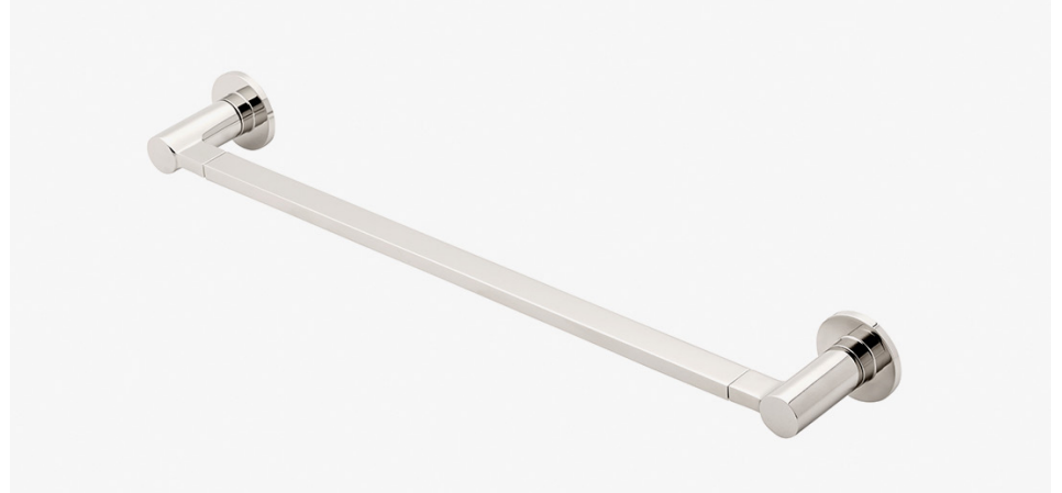
Porte-serviettes 18" MODÈLE : NOTB18