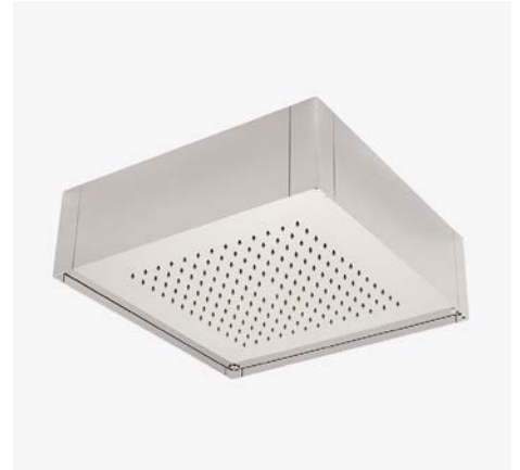
Universal pomme de douche encastrée Cube 15" x 15" MODÈLE : USHF15 (US) / USHF15E (EU)