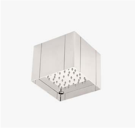
Universal pomme de douche encastrée Cube 6" x 6" MODÈLE : USHF06 (US) / USHF06E (EU)