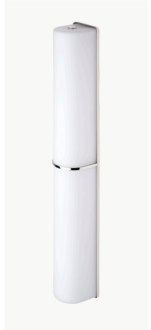
Applique murale double avec abat-jour cylindrique MODÈLE : NO04LT