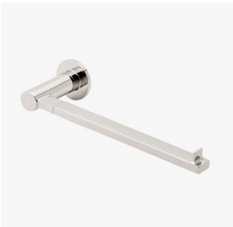
Porte-serviettes 10" pour invités MODÈLE : NOTB10