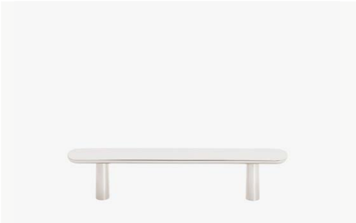
Tirette 4" MODÈLE : NOHW04