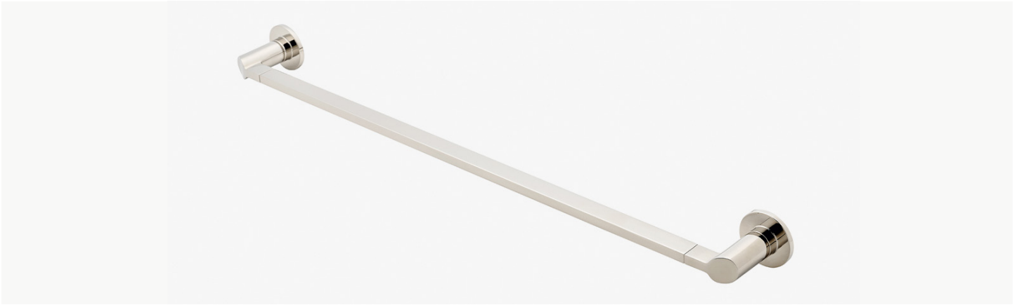
Porte-serviettes incliné 24" MODÈLE : NTB24S