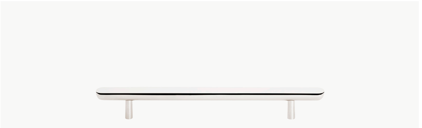
Tirette de 8 ½" pour appareils ménagers MODÈLE : NOHW85