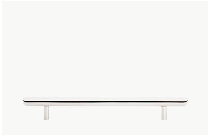
Tirette 6" MODÈLE : NOHW06