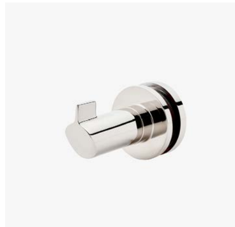
Crochet incliné simple face monté sur verre MODÈLE : NRHG1S