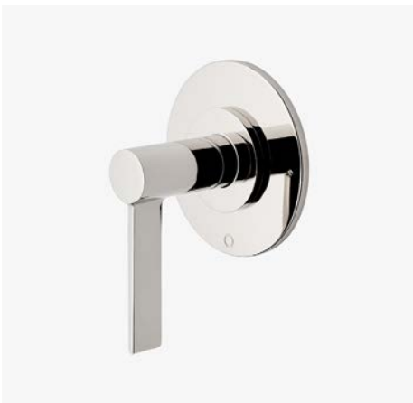
Habillage avec inverseur thermostatique à deux voies avec points modernes et poignée à levier* MODÈLE : NO2T20