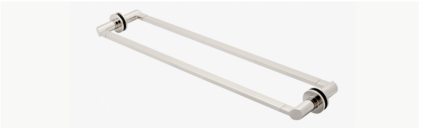
Barre porte-serviette inclinée 24" double face, fixée sur verre MODÈLE : N24G2S