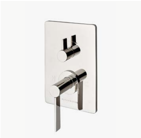
Habillage de robinet thermostatique et de contrôle de débit intégré avec poignée à levier droite* MODÈLE : NVT120