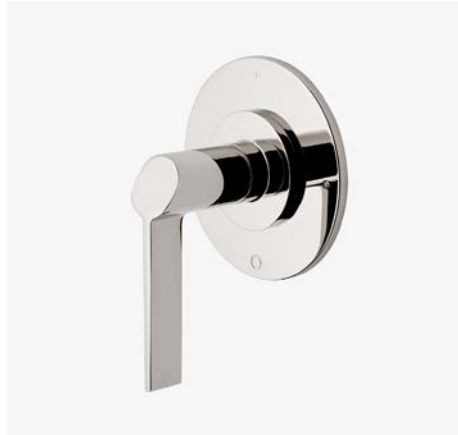
Habillage de robinet avec inverseur thermostatique à trois voies avec points modernes et poignée à levier inclinée* MODÈLE : NO3T60