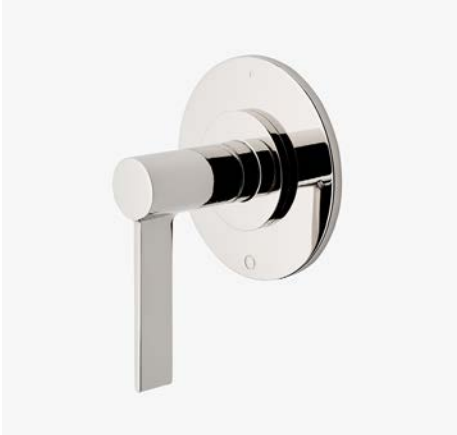
Habillage de robinet avec inverseur thermostatique à trois voies avec points modernes et poignée à levier* MODÈLE : NO3T20