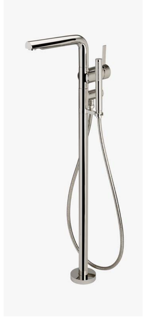
Robinet de baignoire apparent sur pied à un trou MODÈLE : NOXT90