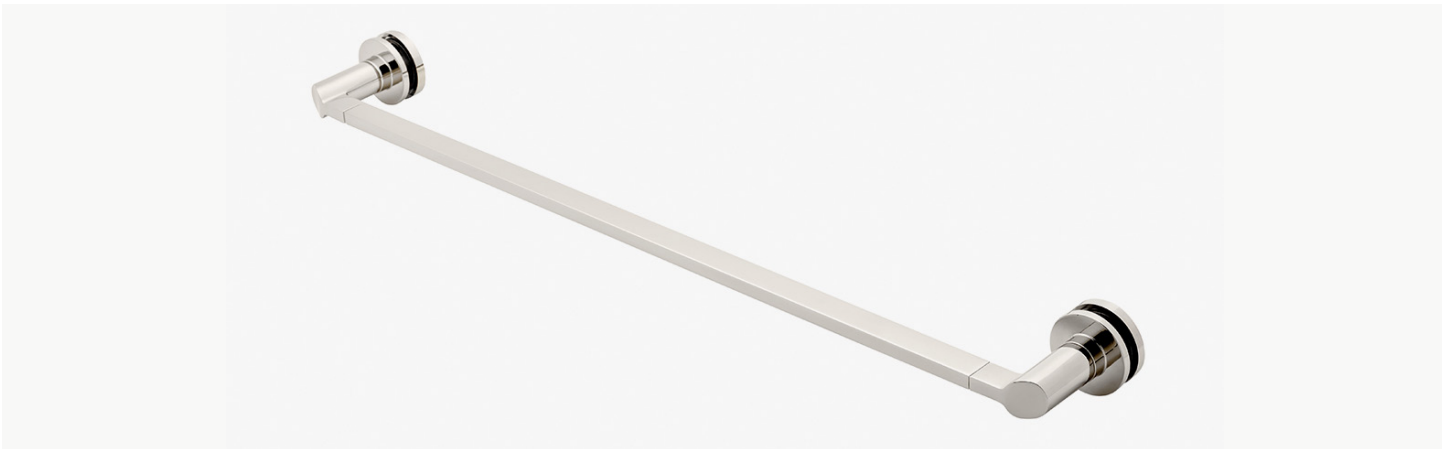
Barre porte-serviette inclinée 24", fixée sur verre d'un seul côté MODÈLE : N24G1S