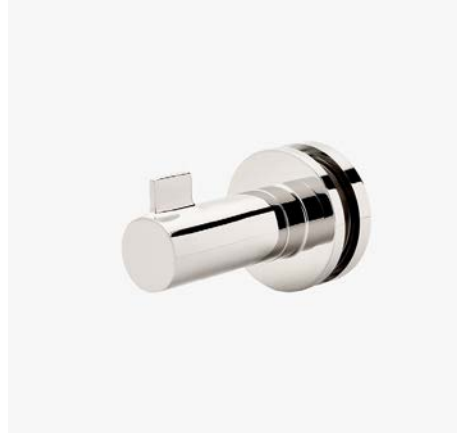
Crochet simple face monté sur verre MODÈLE : NORHG1