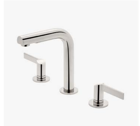
Robinet de lavabo à profil haut avec poignées à levier inclinées MODÈLE : NLS260