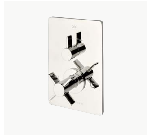
Habillage de robinet thermostatique et de contrôle de débit intégré avec poignée à croisillons* MODÈLE : NVT110