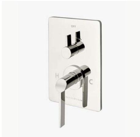
Habillage de robinet thermostatique et de contrôle de débit intégré avec poignée à levier inclinée* MODÈLE : NVT160