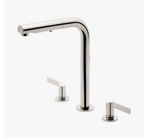
Mitigeur de cuisine à trois trous avec poignées à levier inclinées et douchette intégrée MODÈLE : NKM360