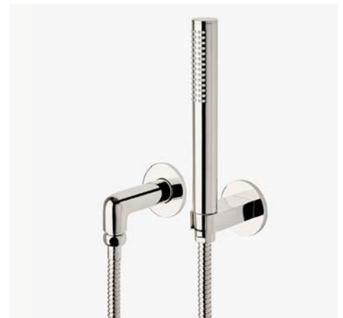
Douchette suspendue MODÈLE : NOHS01