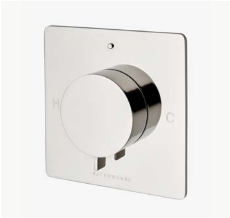
Habillage de robinet thermostatique avec poignée-bouton moleté* MODÈLE : NOTH30