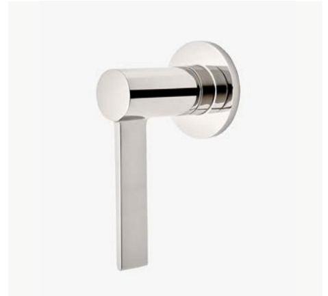
Commande de débit avec poignée à levier* MODÈLE : NOVCE0