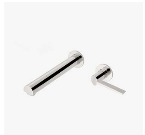
Robinet de lavabo mural avec poignée à levier inclinée simple* MODÈLE : NLS360