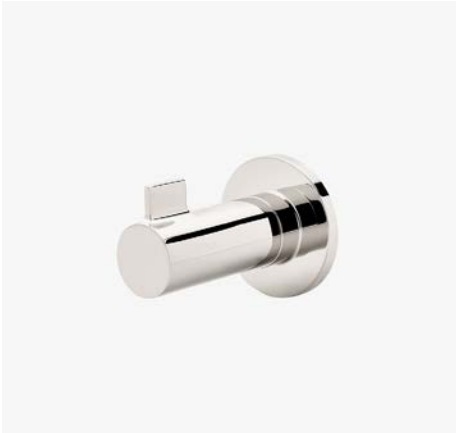
Crochet simple MODÈLE : NORH01