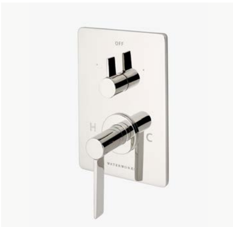
Habillage avec thermostatique et inverseur intégré avec poignée à levier droite* MODÈLE : NVT220