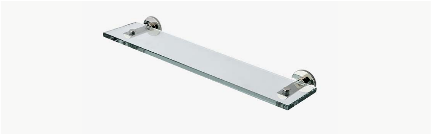
Tablette en verre 18" MODÈLE : NOSF18