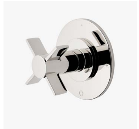
Habillage de robinet avec inverseur thermostatique à trois voies avec points modernes et poignée à croisillons* MODÈLE : NO3T10