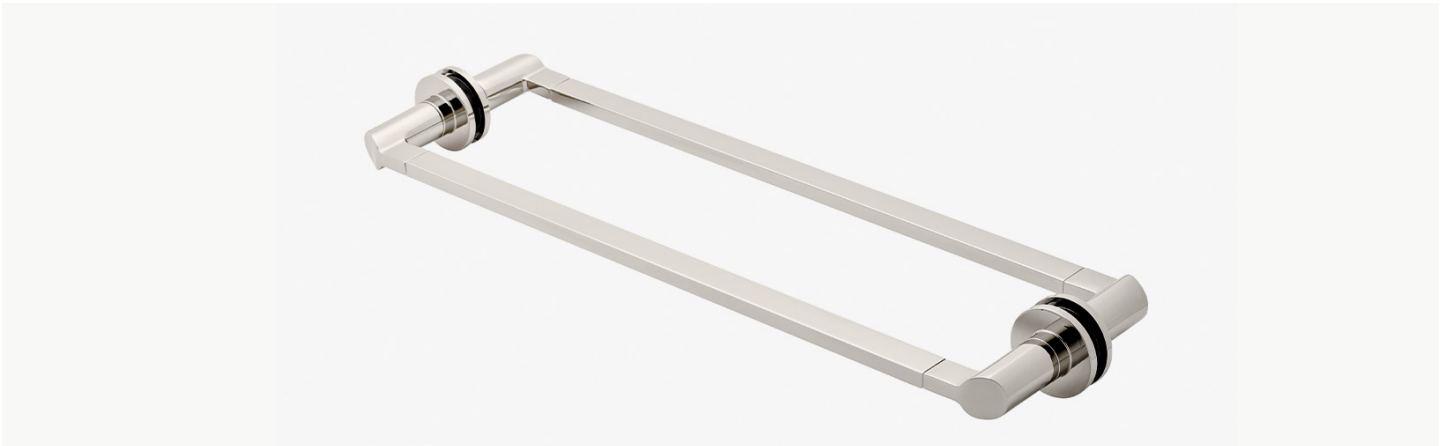
Barre porte-serviette inclinée 18" double face, fixée sur verre MODÈLE : N18G2S