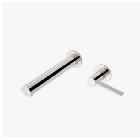
Robinet de lavabo mural avec poignée à levier unique* MODÈLE : NLS320