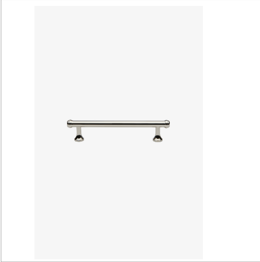
SHOWN IN EASTON TIRETTE DE 15 CM | EAHW06